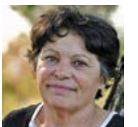
48. Michèle RIVASI Député Européenne